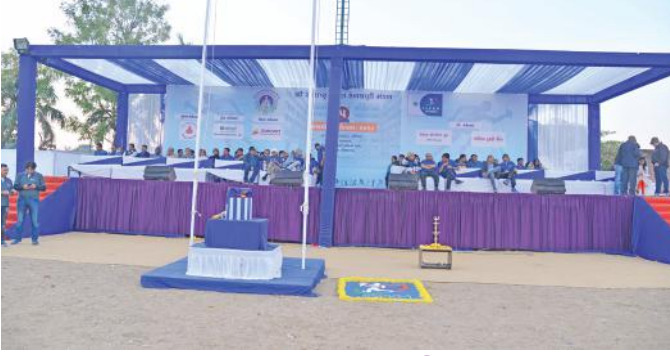
રમતોત્સવના પ્રારંભે મંચ પર ઉપસ્થિત મહેમાનો