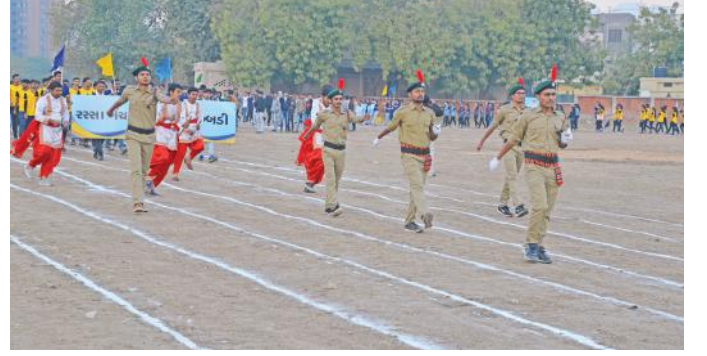
રમતના ભાગરૂપે કરવામાં આવેલી પરેડ