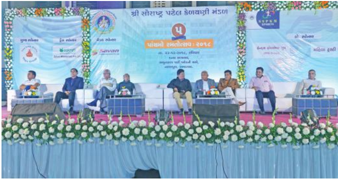
સાંસ્કૃતિક કાર્યક્રમનાં મંચસ્થ મહાનુભાવો