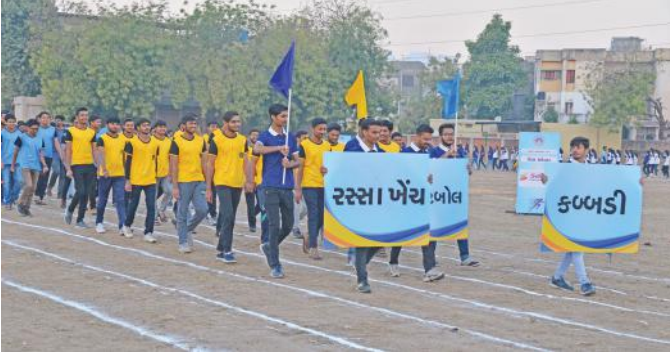
વિવિધ રમતોના પ્લેકાર્ડ સાથે ગ્રાઉન્ડ પર વિદ્યાર્થીઓની કુચ