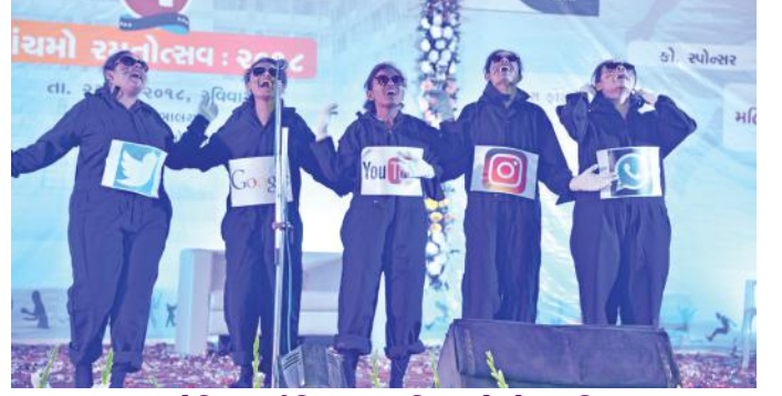
સોશિલય મીડિયા આધારિત અવેરનેસ કૃતિ