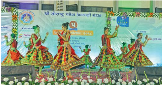
બહેનો દ્વારા યોજાયેલ ગરબા