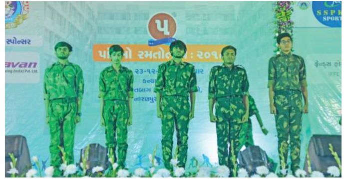
ભાઈઓ દેશભક્તિની થીમ પર યોજાયેલ કાર્યક્રમ