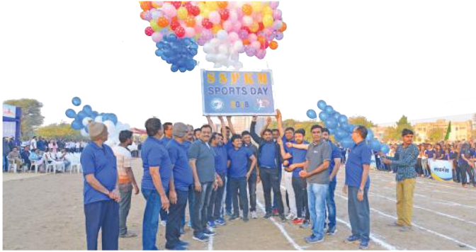
રમતોત્સવની ઉજવણીના ભાગરૂપે છોડવામાં આવેલા બલુન