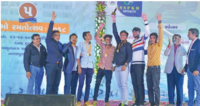
વિજેતાઓ કરાયેલું ઇનામ વિતરણ