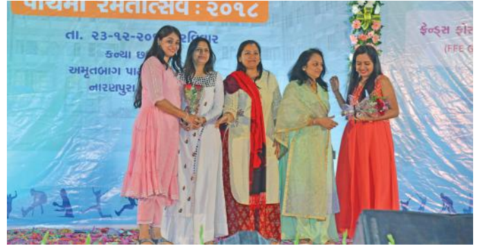
શુભેચ્છા અને અભિવાદન