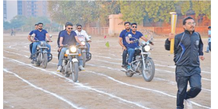
મશાલ રતન તથા બાઈક રાઈડીંગ