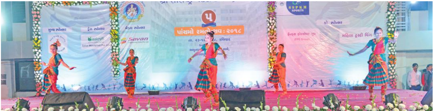
રંગારંગ સાંસ્કૃતિક કાર્યક્રમની એક ઝલક