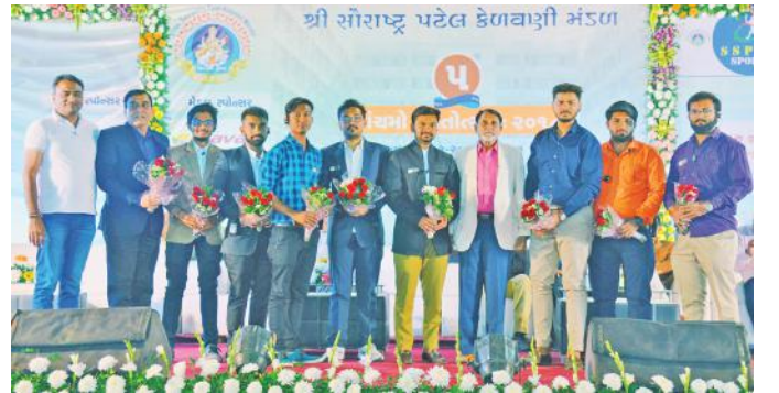
ઈવેન્ટ મેનેજમેન્ટ ટીમ