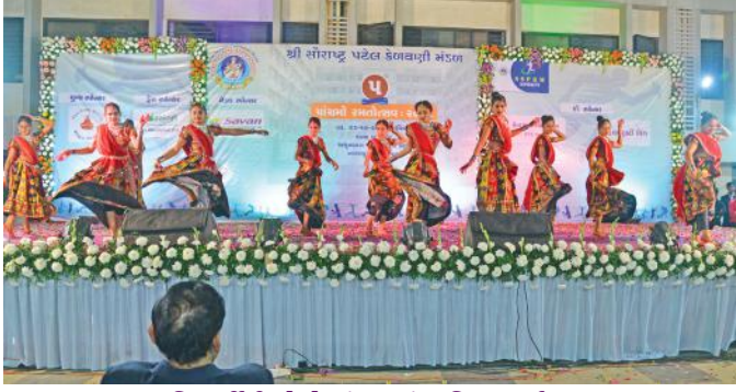
વિદ્યાર્થીનીઓનો સુંદર સાંસ્કૃતિક કાર્યક્રમ