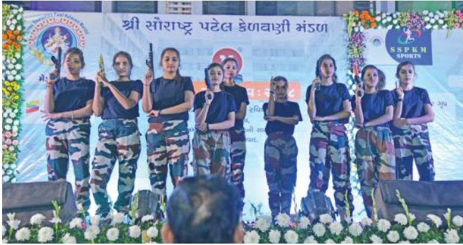
બહેનો દ્વારા દેશભક્તિની થીમ પર યોજાયેલ કાર્યક્રમ