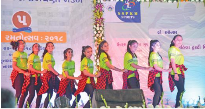
વિદ્યાર્થીનીઓનાં કાર્યક્રમની સુંદર રજૂઆત