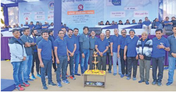
સંસ્થાના ટ્રસ્ટીશ્રીઓ, યુવા ટીમ તથા આમંત્રીત મહેમાનોના હસ્તે દીપ પ્રાગટ્ય દ્વારા રમતોત્સવનો વિધિવત પ્રારંભ કરાયો