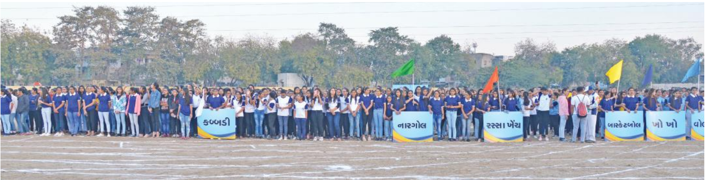
રમતોત્સવ માટે ઉત્સાહભરે જોડાયેલા વિદ્યાર્થી ભાઈ-બહેનો