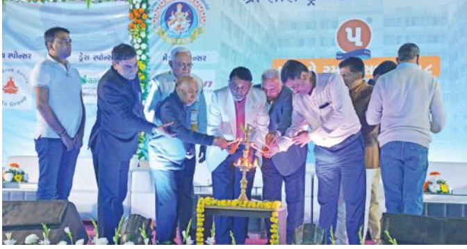
રમતોત્સવના ભાગરૂપે સાંજે યોજાયેલ સાંસ્કૃતિક અને ઈનામ વિતરણ કાર્યક્રમનું મહેમાનો દ્વારા દીપ પ્રાગટ્ય અને પ્રમુખશ્રીનું ઉદ્બોધન