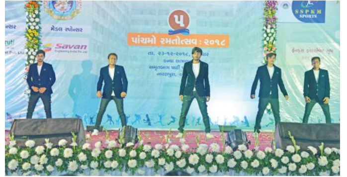
વિદ્યાર્થીઓનાં કાર્યક્રમની સુંદર રજૂઆત