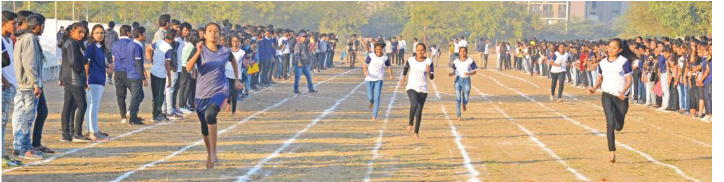
રમતોત્સવના ભાગરૂપે ભાઈઓ-બહેનો વચ્ચે યોજાયેલી વિવિધ અંતરની દોડ