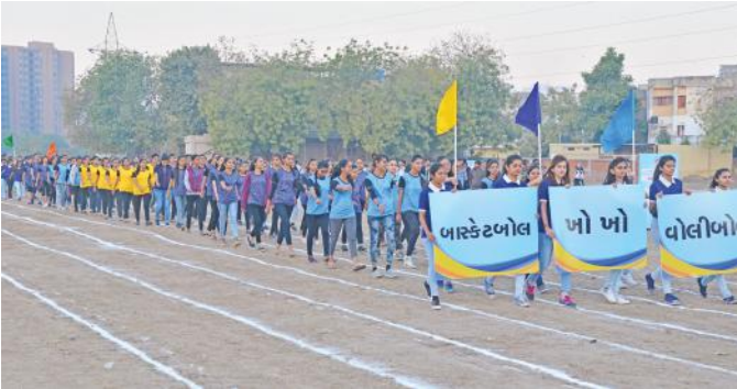
ગ્રાઉન્ડ પર વિદ્યાર્થીઓની કુચ