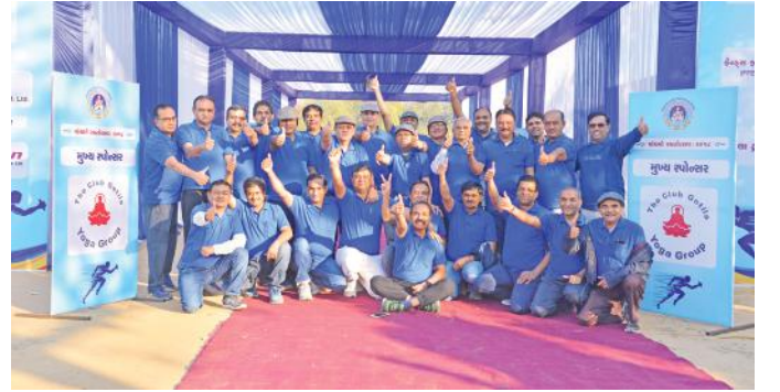
રમતોત્સવ પ્રસંગે ચિયર-અપ કરી કરેલા યુવા ટીમના સદસ્યો