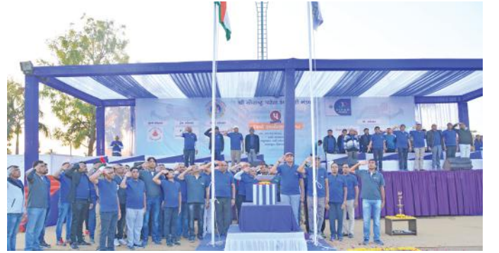
રાષ્ટ્ર ધ્વજ તથા સંસ્થાના ધ્વજને અપાયેલી સલામી