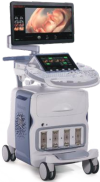
Voluson E8 BT-18 radiance