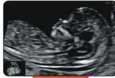
NT - સ્કેન